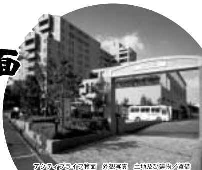
アクティブライフ箕面 外観写真 土地及び建物/賃借