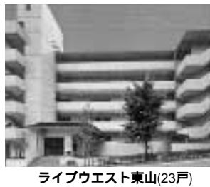
ライプウエスト東山(23戸)

次の住宅については、家賃補助が受けられます。住宅・入居者負担額(収入基準により決定します) 芦屋ゼンイ勢(伊勢町3-14)、105,000円~ ライプウエスト東山(東山町27-7)、75,100円~メルベ・ユ朝日ヶ丘(朝日ヶ丘35-3)、74,700円~エクセル芦屋(業平町2-8)、101,900円~芦屋ゼン業平(業平町5-18)、108,800円~タウンハウス芦屋川(西山町5-5)、106,300円~ については、所得により公社負担で10月から最大2万円引き下げています。入居資格 入居しようとする家族全員の合計所得が基準に該当するかた申し込み 所得を証明できる書類と印鑑を、下記へご持参ください。詳細は、市ホームページ(http://www.ashiya-tosi-seibi.or.jp)をご覧ください。