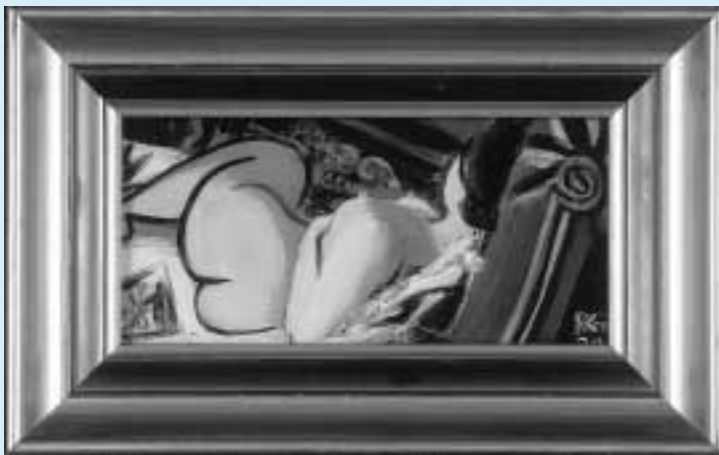
小出楯重《ソファアの裸女》1930(昭和5)年 10.0×19.8cm 油彩・ガラス

大正15(1926)年より昭和6(1931)年に没するまで芦屋に居住し、数々の裸婦像を手がけた小出楯重は、ガラスというものに「特殊な愛着」をいだき、ガラス絵が放つ「不思議な光沢と色感」に、こどもの頃から惹かれていたといいます。絵具を塗った面を裏返して鑑賞するかたちになるガラス絵のもっとも大きな特徴は、ふつうの油絵とは描き上げてゆく順序が逆になる点です。つまり、油絵ならば背景を塗ってから手前にあるもの、光がより強く当たっているものを描いてゆきますが、ガラス絵ではハイライトの部分から始め、最後に背景を仕上げるのであり、サインは一番最初に入ることになります。描く画家自身、裏返して見なければでき上がってゆく過程を確認できないため、思ってもみなかった表現が生まれやすいこともガラス絵の特質として挙げられます。また小出は、ガラス絵ではどのような額縁をつけるかが重要だと語りました。この作品でも、寝台のかたちとよく合った直線的な額縁を選び、裸婦のなめらかな表現をいっそう際立たせています。