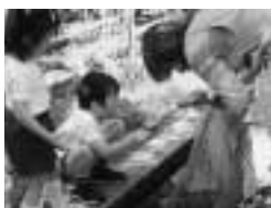
潮見幼稚園 / 池の藻すくい

園庭には、草木や小さな池があります。幼児にとって魅力的な場所です。小さなエビ・ヤゴ・アメンボ・メダカなどを網で捕まえたり、草むらや石の下のダンゴ虫などの生き物を夢中でつかんだりします。時には、座り込んでじっと見つめていたり、追いかけてりする幼児もいます。初めは、一人でもいつのまにか数人の幼児と一緒に行動しています。いろいろ教えあったり、譲りあったり、つかむのが怖くて「つかまえて」と頼んだりしている姿を見かけます。教師は、幼児の会話や行動を見て、生き物の様子や命あるものの扱い方に目を向けさせたり、時には友だちとのより望ましい意思疎通の仕方考えさせたりします。 幼稚園では、自然に親しみ触れる機会をできる限り多く取り入れながら、身近な動植物をいたわったり大切にしようとする心を育てています。