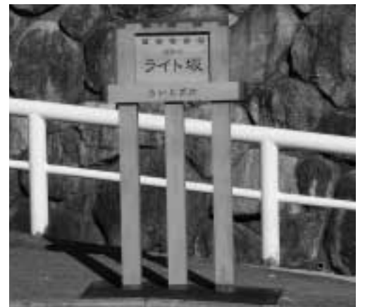
ライト坂 (全長 0.98km)

開森橋から山麓線に至る、芦屋川左岸沿いの坂道の多い道路。北上すると、芦有道路を経て有馬につながります。