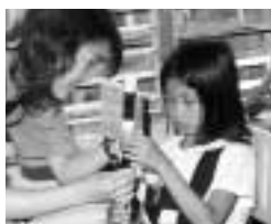
フィリピンスクールプロジェクト

「人と文化を育てるまちづくり」 教育委員会以外の事業 男女共同参画施策 第二次芦屋市男女共同参画行動計画」に基づき、男女共同参画社会の実現を目指します。 国際交流事業 芦屋市国際交流協会設立十周年記念事業や協会主催の「フィリピンスクールプロジェクト」プロジェクト事業を支援します。