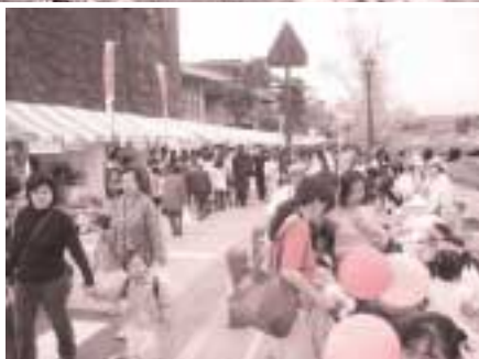
業平橋東交差点～(開森橋を經由)～業平橋西交差点