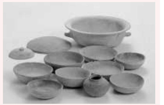
芦屋の古代の食器

芦屋は、古代の阪神地方の政治・文化の中心地だったようです。今風に言えば、県庁の所在地とみていいかもしれません。文献史料を分析する る古代史と出土品を相手にしている考古学は、一見違う分野に見えますが、歴史を還元する上で常に表裏の関係にあります。 これから八回の連載を通して、古代芦屋の氏族や役所の成り立ちなどを探ってみましょう。古代史と考古学の接点から想像もできなかった芦屋の歴史像や地域像が浮き彫りにされるものと思います。