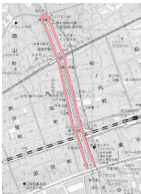
業平さくら通り(全長1.59km)