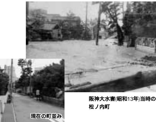
阪神大水害(昭和13年)当時の 松ノ内町