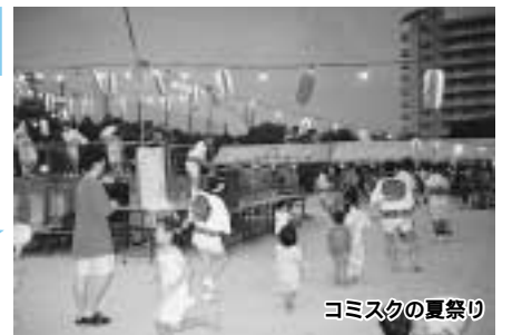
コミスクの夏祭り