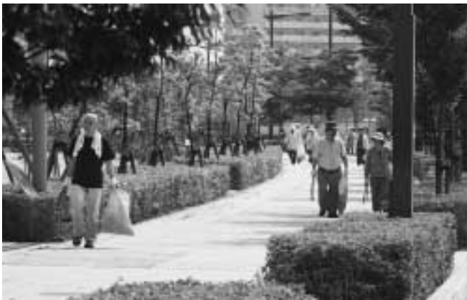
第33回春のわがまちクリーン作戦を実施

6月16日、約1,500人のかたがたが参加し、春のわがまちクリーン作戦が行われました。花火の燃えがらや空き缶、解体廃材など、8.2トンのごみが集められました。