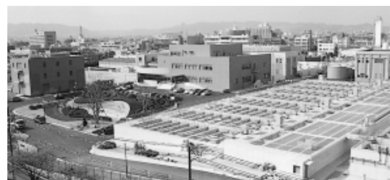
完成した阪神水道企業団尼崎浄水場(尼崎市南塚口町)