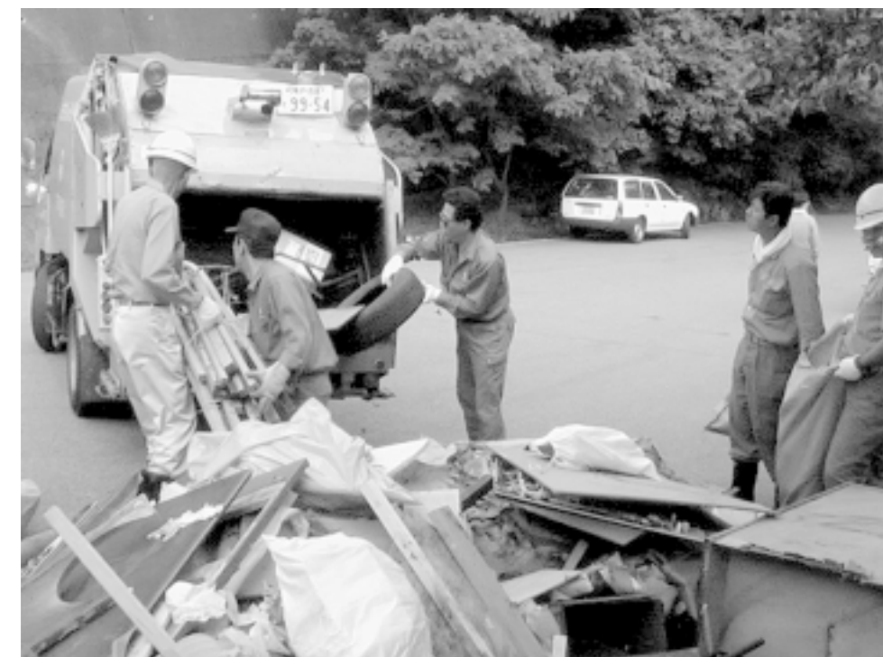
芦屋川の水源保全作戦で回収された大量のごみ。水源保全にご協力を！