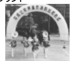
昨年の市長賞受賞作品

日 時 1月14日(日)午前10時～正午 会 場 精道小学校グラウンド 内 容 1部: 式典 2部: 救急・救助・ 消防演技 *お子さんには顔抜き マンガ、救急バイク の写真撮影や風船を プレゼントします。 家族おそろいでご来場ください。 *写真コンテストを同時開催します 問い合わせ 消防本部総務課 ☎38-2095