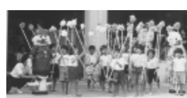
明るく楽しい保育所での一日

*延長保育の時間は、午後6時～7時までです。(別途申し込みが必要です) *一時保育は随時受付をしています。(就学前のお子さんをお預かりします)