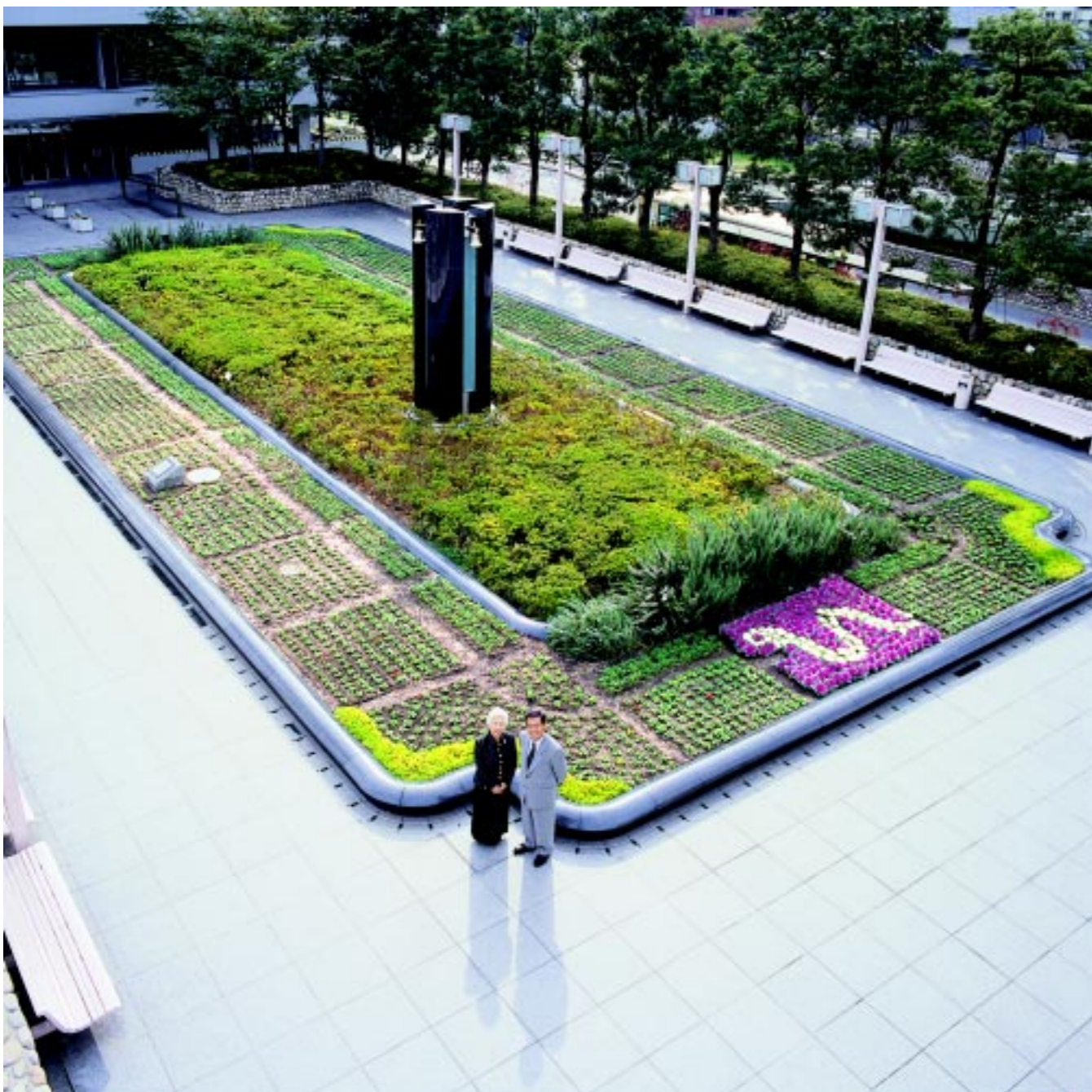
芦屋市平和モニュメント前にて 演出 / 大森一樹(映画監督) 題字「新世紀の春」 / 北村春江

☎0797-31-2121 〒659-8501 兵庫県芦屋市精道町7番6号 ホームページ http://www.city.ashiya.hyogo.jp/ メールアドレス info@city.ashiya.hyogo.jp