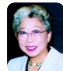
元会長として活躍されています。

新しい世紀の始まりに、共に巡り合えたことは誠に喜ばしく、おめでたいことこの上ないです。地震・水害など天災の試練を幾度かくりながらも、私は国際文化住宅都市としての誇りをもち、緑の日本あり青い海のあるわが街こそ、日本一の故郷だと信じている生粋の芦屋っ子です。それだけに次の世代がいつまでも平和で温かい心の通い合う街であって欲しいと願っています。