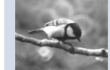
市内でよく見かけるシジュウカラ