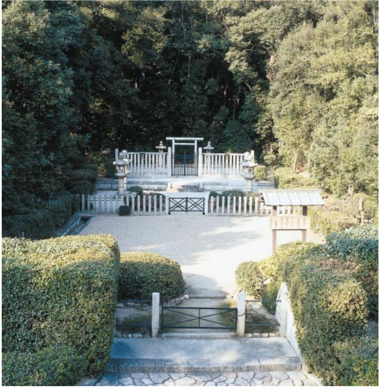
演出 / 大森一樹(映画監督) イラスト / なかにし和子