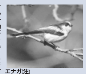
エナガ(注) 岩園町のアケマツの幹にとまるコガラ