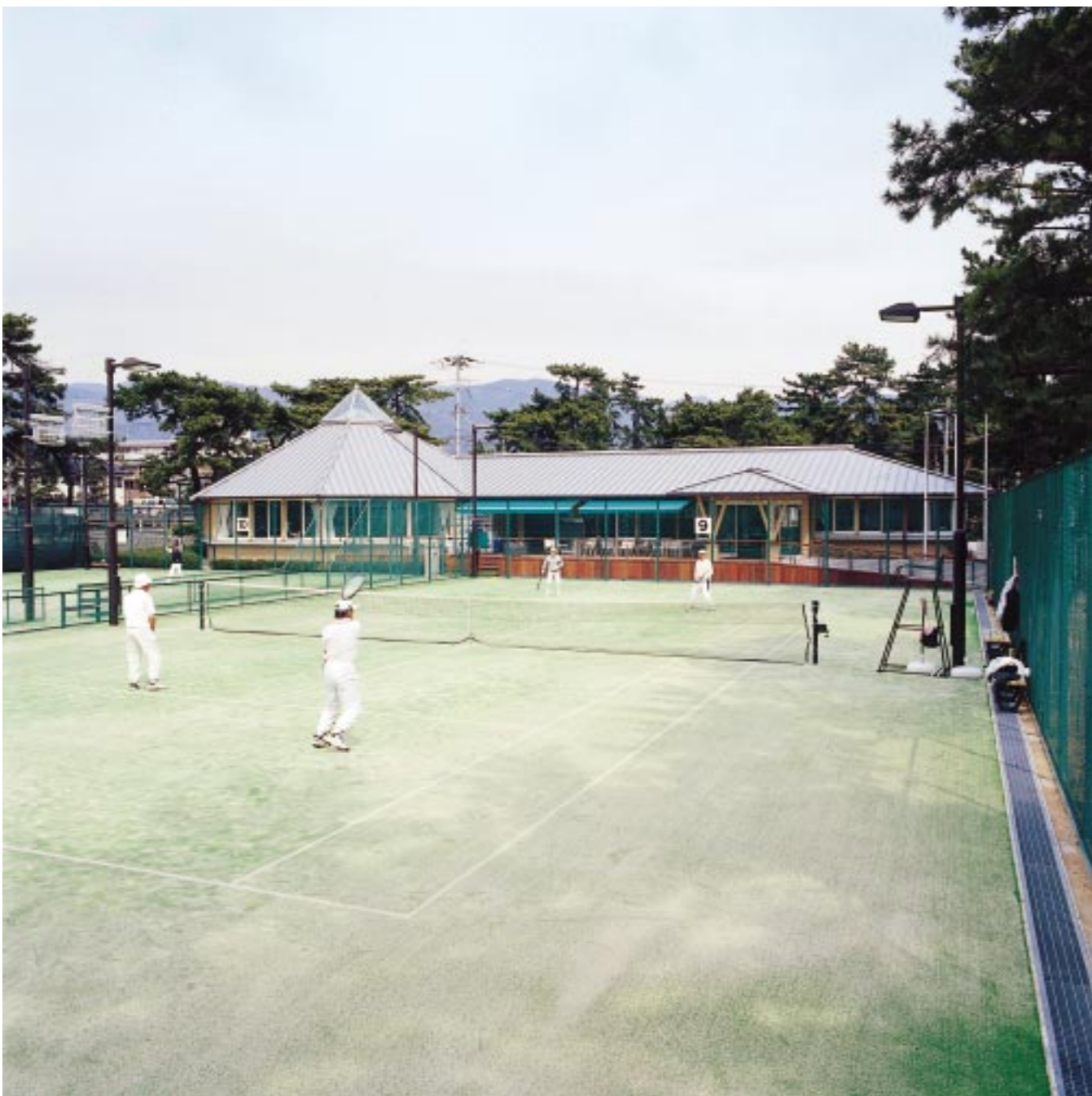
演出 / 大森一樹(映画監督) イラスト / なかにし和子

☎0797-31-2121 〒659-8501 兵庫県芦屋市精道町7番6号 ホームページ http://www.city.ashiya.hyogo.jp/ メールアドレス info@city.ashiya.hyogo.jp