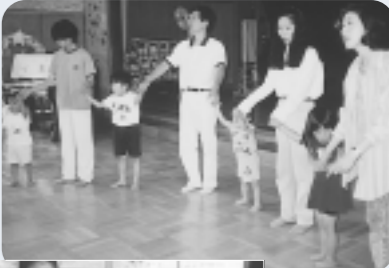
なかよしひろばのようす(なかよしひろばは、市内の各幼稚園で開催しています。詳しくは、子育てセンターまで)