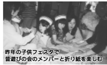
昨年の子供フェスタで昔遊びの会のメンバーと折り紙を楽しむ

日時 5月13日(土)午後1時～3時 会場 精道幼稚園 遊戯室・園庭 対象 ご家族でお越しください