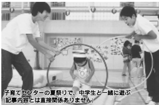
子育てセンターの夏祭りで、中学生と一緒に遊ぶ(記事内容は直接関係ありません)

いじめ・いやがらせ、名誉毀損、信用問題等でお困りのかたは、お気軽にお越しください。人権擁護委員が相談に応じます。秘密は厳守します。 日時 毎月第2・4火曜日、午後1時～4時 次回は5月9日(火)です。 会場 市役所北館2階会議室(2) 予約 下記へ 問い合わせ 生活環境部人権推進担当 ☎38-2055