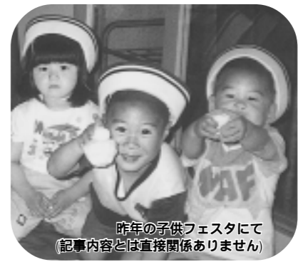
昨年の子供フェスタにて(記事内容は直接関係ありません)