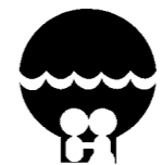
芦屋市の人権シンボルマーク