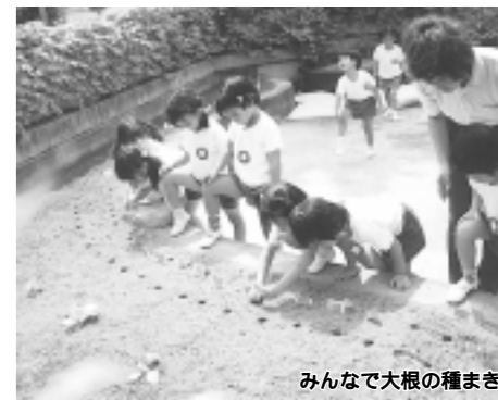
みんなで大根の種まき

教育委員会では、地域に根ざした特色ある学校園づくりを推進しています。今回は教育ボランティアとして地域のかたがたにご指導いただき、生き生きと体験活動が行われている3つの幼稚園を紹介します。