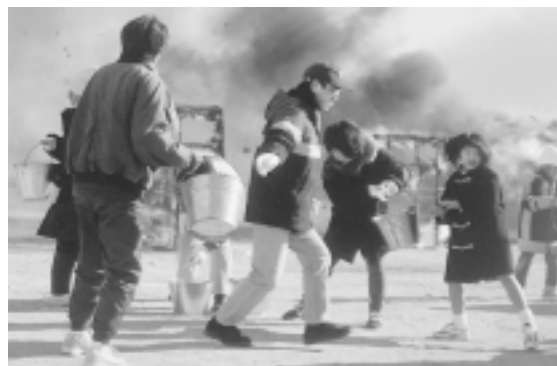
阪神広域防災訓練・芦屋市防災総合訓練を実施 1月20日、南芦屋浜で行われた防災訓練では、自主防災会等、約900人が参加。潮見・浜風・打出浜の各小学生もバケツリレーによる消火活動等に参加しました。

発行 / 芦屋市役所(広報課) ☎0797-31-2121 〒659-8501 兵庫県芦屋市精進町7番6号 ホームページ http://www.city.ashiya.hyogo.jp/ メールアドレス info@city.ashiya.hyogo.jp