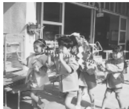
神輿で園内を練り歩く

園外保育の途中でありさつしてください。近くの商店のかたのまなざしはやさしい。園児たちが地域の中で守られていることを実感します。しかも、園児たちは、自分が住んでいる地域の事を意外と知りません。そこで園児たちが地域を知るきっかけにしたいと考え、打出神社のだんじりのお雛子を聞かせていただく機会を作りました。園区外になりますが、打出天神社は園児たちにとって身近に感じて欲しいところです。きれいに飾られた山車から飛び出す、鉦や太鼓の音は、おなかの底まで響き渡りました。あくらをかいて勝てリズムをとると、手拍子で打つ子、友達と顔を見合わせて頭でリズムをとっている子、思い思いに楽しんでいました。園の様子はその日のうちに保護者に伝えました。保護者にも地域とのつながりを大切にして欲しいと願っています。