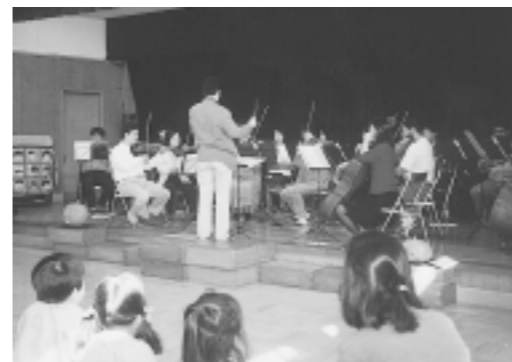
芦屋交響楽団の演奏に聴き入る園児たち

ちの姿がありました。十二月四日はハンドベル鑑賞をし、二十日には二年を迎えるにふさわしい、しめなわ作りを保護者のかたがたと楽しみました。自分で縄を編み、作り上げたしめなわは、各園児の家の玄関等に飾られたことでしょうか。このプログラムを通して、心の奥まで響いてくる生きた音楽を聴くことや、日本の伝統的な行事や遊びを守り、伝えていく大切さを改めて感じることができました。今後も、教育ボランティアのかたがたのご協力により、園児たちと共に楽しさを味わいながら保護者と一緒に楽しんでいきます。