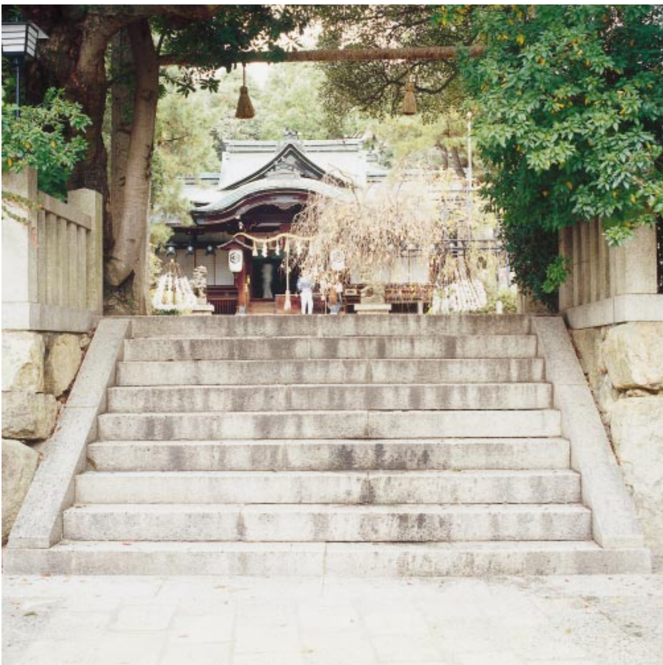
演出 / 大森一樹(映画監督) イラスト / なかにし和子