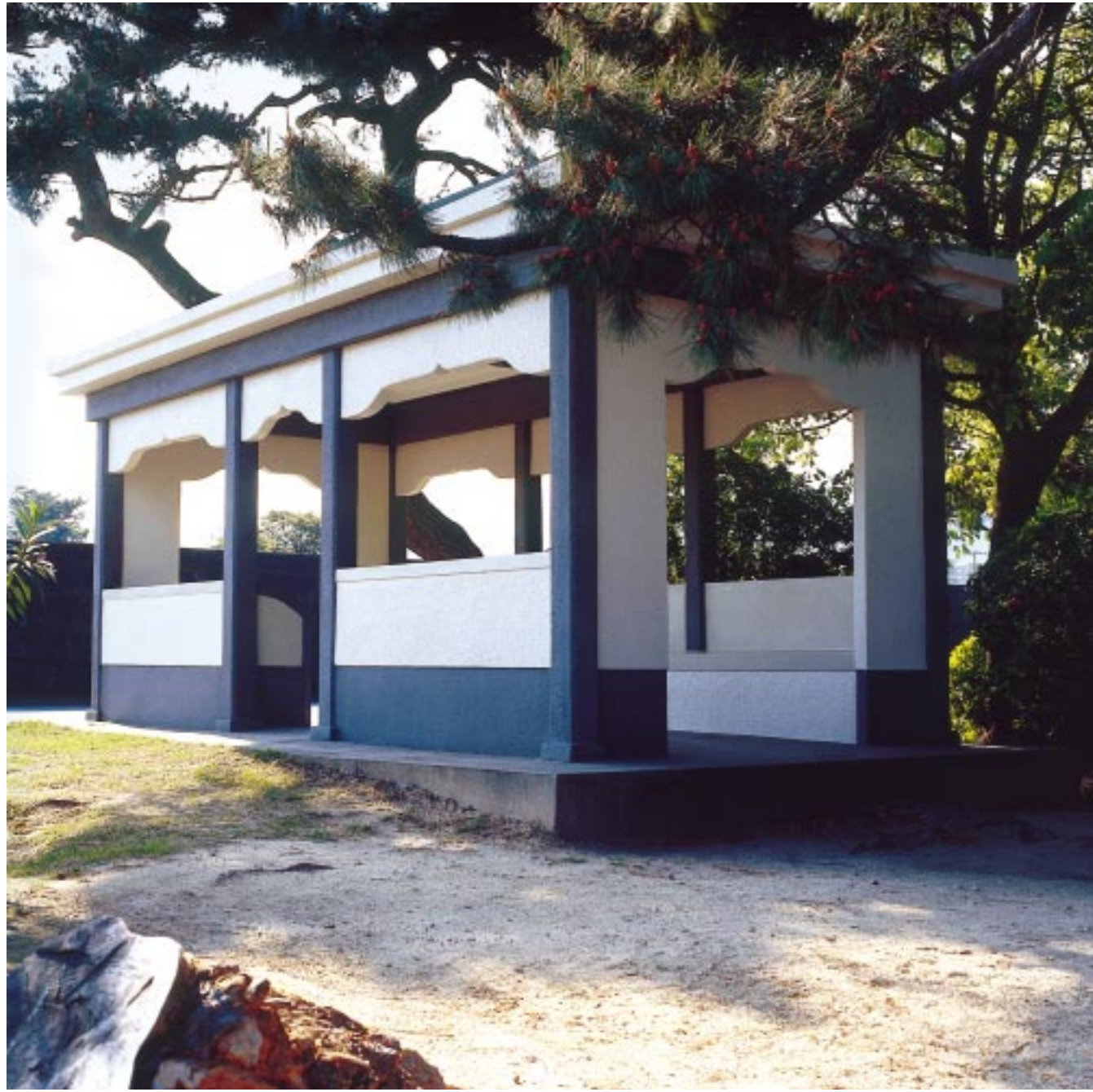
演出 / 大森一樹(映画監督) 撮影 / 山口宏(写真家) イラスト / なかにし和子

発行 / 芦屋市役所(広報課) ☎0797-31-2121 〒659-8501 兵庫県芦屋市精進町7番6号 ホームページ http://www.city.ashiya.hyogo.jp/ メールアドレス info@city.ashiya.hyogo.jp