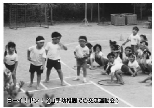
ヨーイ！ドン！(山手幼稚園での交流運動会)