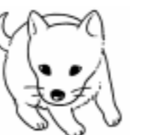
狂犬病予防注射と犬の新規登録のお知らせ

本籍地 筆頭者氏名 謄抄本の別(抄本は必要かたの名前) 必要通数 用途 住所 依頼者氏名 電話番号を記入のうえ、返信用封筒・切手・手数料(定額小為替 郵便局で販売)を同封して本籍地の市町村役場の戸籍係へ送付してください。 手数料 戸籍謄抄本 450円 除籍謄抄本 750円 改正原戸籍謄抄本 750円 附票 (250円) 身分証明書2項目 (500円) ( )の手数料は各市で異なります。