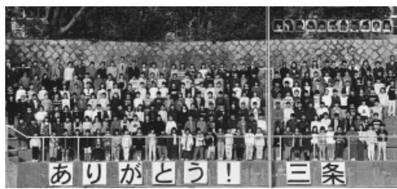
三条小学校全校生224人大集合。平成10年秋。

65年・21年と長い伝統をもつ山手幼稚園・三条小学校。これまでに培われてきた志は、新しい西山幼稚園・山手小学校に受け継がれて行くことでしよう。