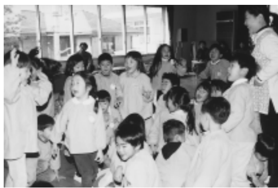
劇遊びに興じる子どもたち(精道幼稚園)

三条小学校が建つ以前、この辺りは古墳・池・竹藪などが多く、自然に恵まれた土地でした。本校北端にある竹藪はその名残です。また、運動場は大きな池だったそうです。代々この地に住んできたかたが、その三条小学校も平成十一年三月末をもって山手小学校と統合することになりました。多い時には、六百六十人を数えた児童数も三分の一に激減してしまいました。しかし、創立当初から開かれた学校として種々の話題の発信地であり続けてきました。高齢者を招いての交流給食やはがきによる交流、幼児を招いての三菜夏祭り、研究発表会もその一つです。三条小学校最後の第十九回研究会は県内外からの参加者を迎えて十月に終了しました。平成九年度からは一部教科担当制を取り入れ、全教職員で児童を見守ってきました。これから三条小学校の築いてきたひとつひとつの積み重ねに終止符が打たれますが、三条小学校で学んだことが卒業生千三百六十四人・在校生二百二十四人の心に誇りとなって生き続けることを確信しています。