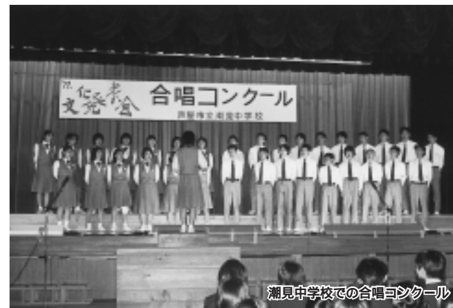
潮見中学校での合唱コンクール

心身ともに たくましい力を育てる 健康教育の推進 一人ひとりが個々の体力や年齢に合った、いつでもどこでもスポーツを生徒にわたって楽しむとともに、健康で明るく豊かな生活を営むためには、教科にとどまらず、特別活動などを通じて積極的な生涯体育・スポーツ活動を実践する能力や態度を育て、体力の向上を図ることが大切です。そして、健康で安全な生活を送る基礎を培うため、家庭や学校医などの連携を図り、保健室の機能を十分に生かしながら、教育活動全体を通して健康教育を推進します。