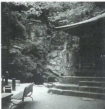
滝までは阪急芦屋川駅から約20分、山の冷気を十分味わえる

ハイカーのもう一つの憩いの場として奥池をあげねばなりません。戦前の奥池は踏跡程度の山道をブッシュをかきわけ辿(たど)り着いたところに周囲の山々の緑を静かな水面に映しハイカーを優しく迎えてくれました。付近は小鳥の鳴き声以外静寂そのもので桃源郷のようでした。戦後芦有道路の開通と共に奥池の南側に新しい奥山貯水池が誕生、付近一体は現代風の美しい建物が建築されましたが、広く明るい環境は、付近の自然と調和して近代的なハイカーの憩いの場所として現在も親しまれ、毎年五月には二、三千人のハイカーを集め、『あしや山まつり』が楽しく開催されております。