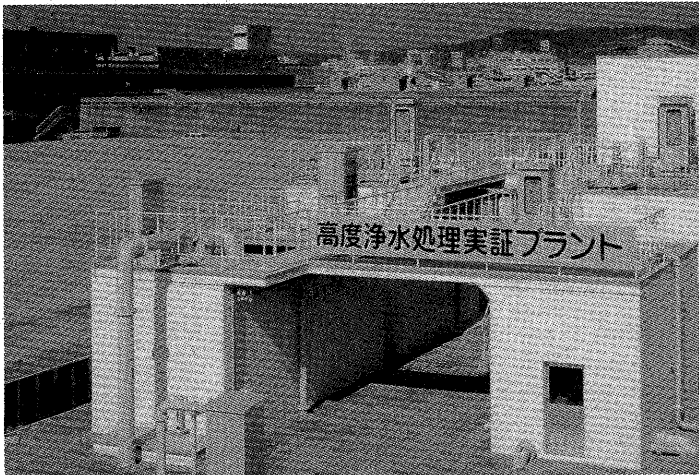
臭味や微量有機物を削減し、より安全な水を供給するための実験を続けている阪水猪名川浄水場

八月一日は「水の日」で、それから一週間を「水の週間」として、限りある水資源を大切にすることを訴えています。