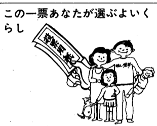
この一票あなたが選ぶよいくらし