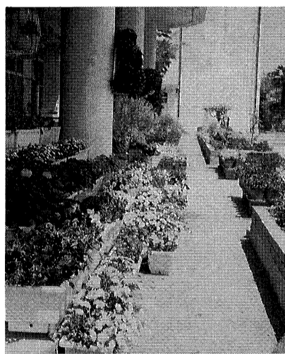
山手小学校の100メートル花壇

変え、花壇が傷まなくなってきた。そして、花の手入れをしていると「手伝います」と寄ってくる、そんな子が増えてきたというのが山手小学校。