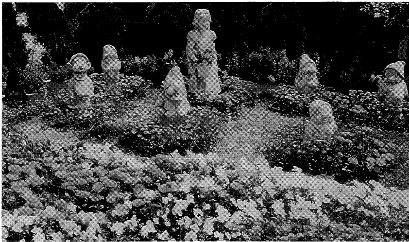
夢の国を思わせる小槌幼稚園の花壇