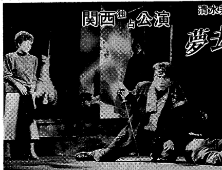
阪神間主要PG、チケットセゾン、チケットぴあにて好評前売中!

1月8日(日)午後2時からの「ニューイヤークンサート」を3月17日(金)午後7時に変更いたしました。あしからず、ご了承ください。