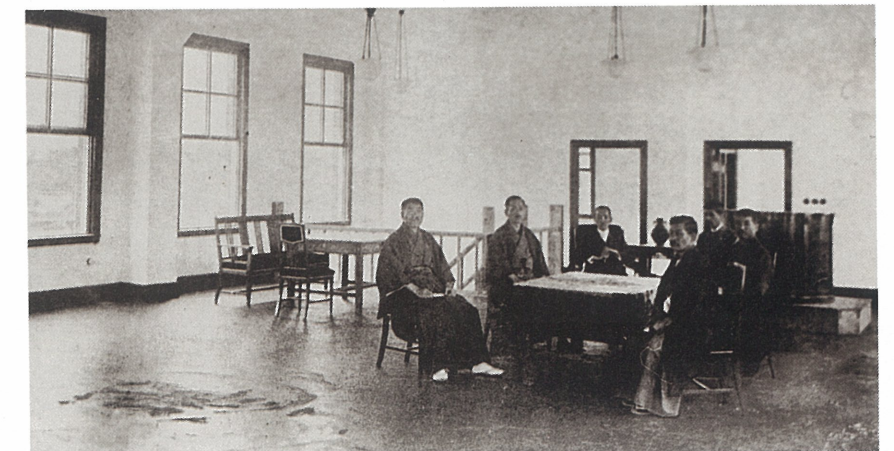
新築当時の精道村役場内の風景