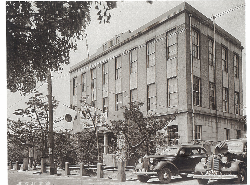
新築された精道村役場 大正12年6月14日竣工。

新築の村役場は、鉄筋コンクリート造3階建て、敷地572坪、建坪56坪9合、総工費約63,000円で、当時日本一の村役場といわれました。