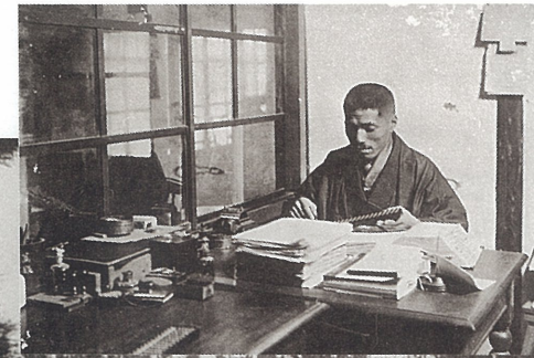
精道村誕生当時の役場執務風景