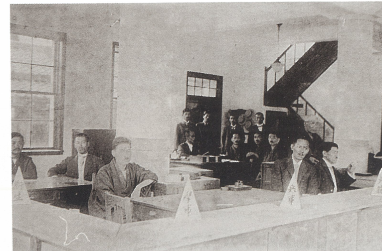
新築当時の精道村役場内の風景