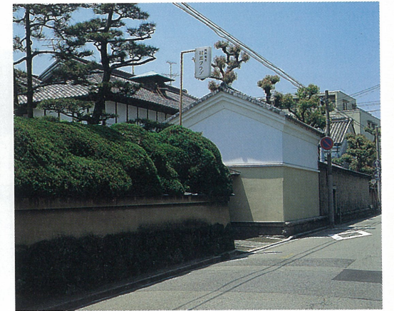
関西電力打出クラブ