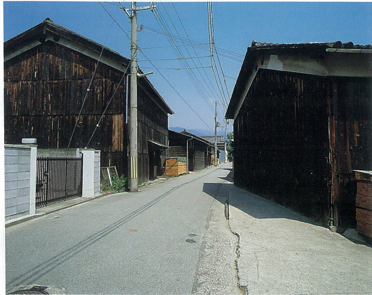
海辺の街並み(松浜町、伊勢町) 海岸にいたる旧道に沿って、大正初期の材木倉庫が並び、古き芦屋をしのばせてくれる。

現在、旧芦屋海岸の名残をとどめるかつての防潮堤は、散歩やジョギングのコースになり、この北側に点在する松の木立に囲まれた和風邸宅や、モダンな洋館が、昔日の海辺の雰囲気を与えています。