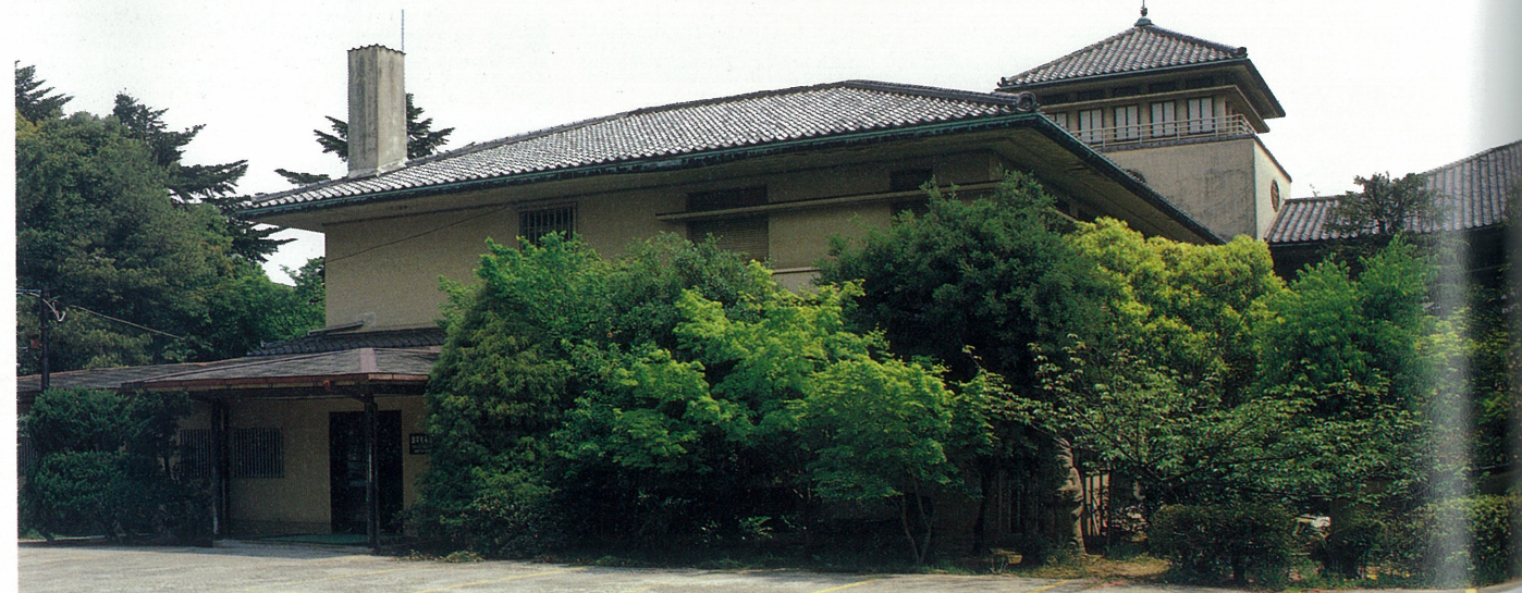
滴翠美術館 昭和7年に建てられた山口吉郎兵衛氏の邸宅を、同氏のコレクションを展示する美術館として再利用したもので、安井武雄氏の設計による和風モダニズム邸宅。