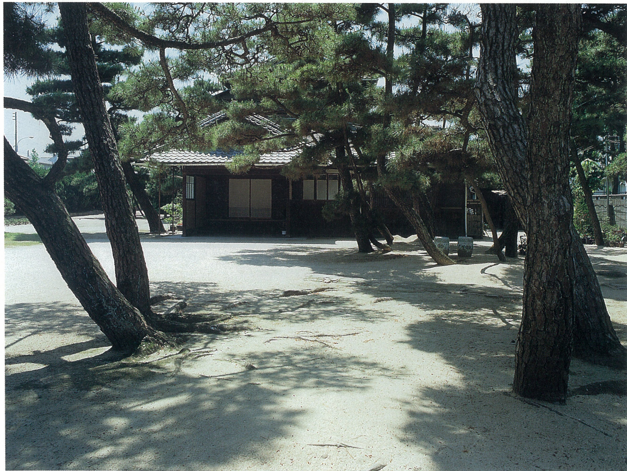
三菱鉱業セメント「松籟荘」(松浜町) 大正9年、大阪の旧家によって建てられた伝統的な和風別荘。美しい庭園に白砂青松の面影を残している。