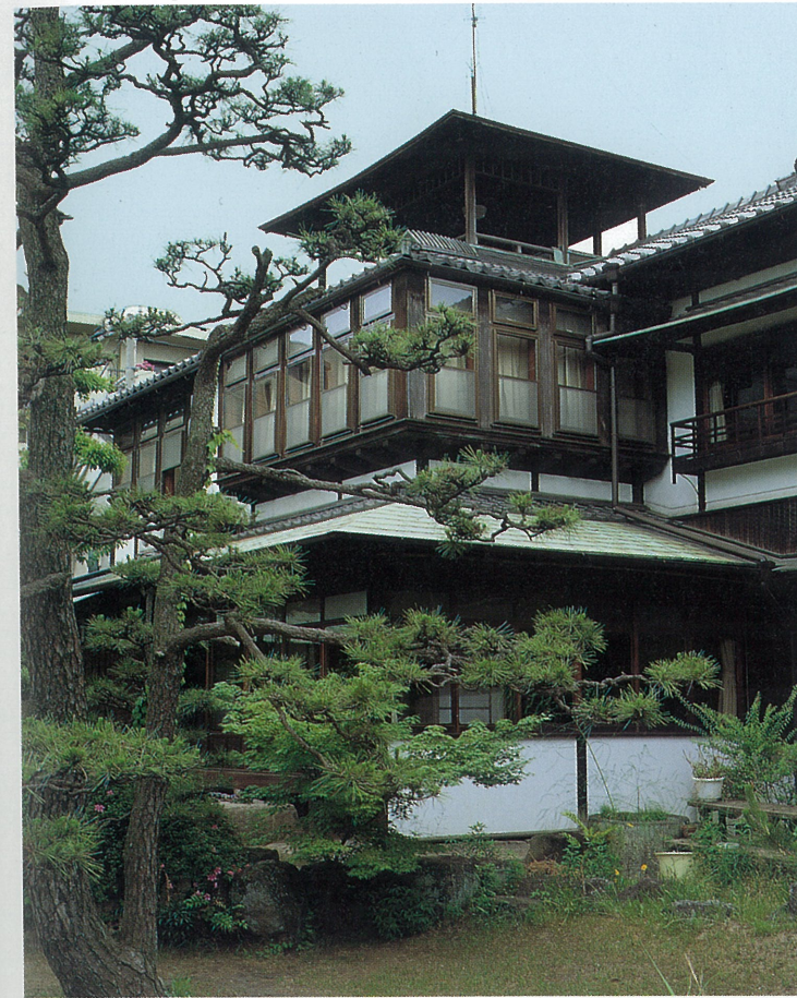
関西電力打出クラブ(浜町) 大正9年、打出浜近くに建てられた大邸宅。和風を基調としながら、内部にはモダンな洋室も備えている。