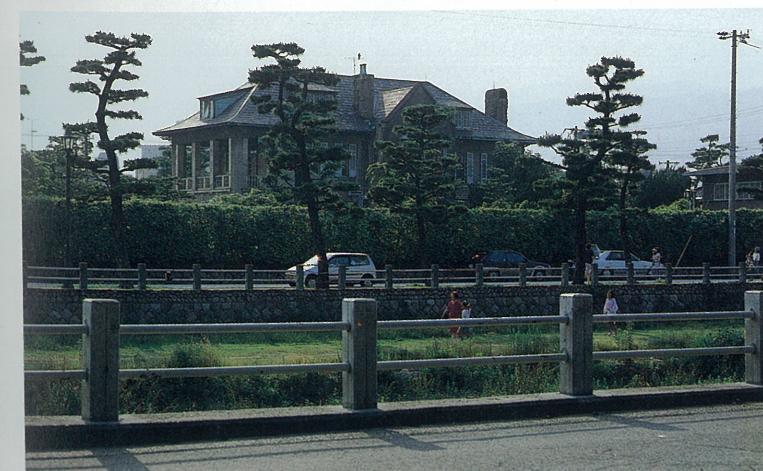
芦屋川沿いに建つ洋館