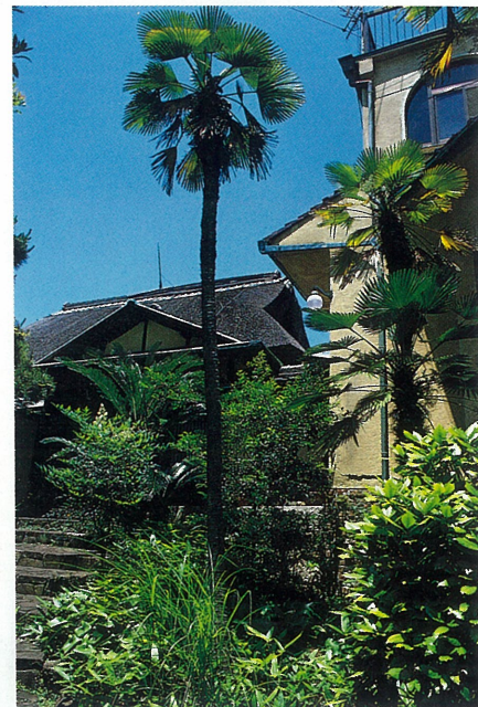
民家と洋館 赤い屋根の洋館と並んで建つ民家は、昭和3年近江八幡から海路移築されたよし葺きの旧家。門にかかる「五里庵」の銘は松方正義によると伝えられる。