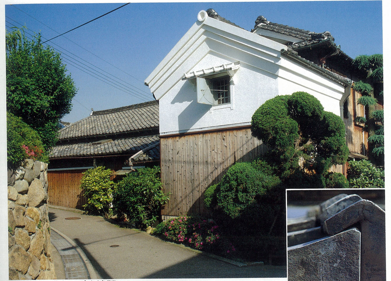
重厚な打出瓦葺きの旧家(三条町)