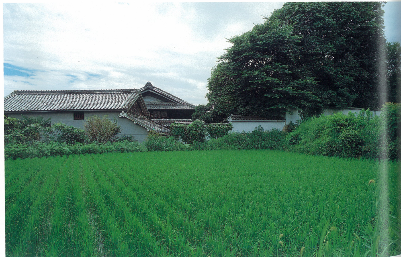
岩ヶ平の田園風景(岩園町) 17世紀に新田開発が行われ、旧打出村最北の集落を形成した。