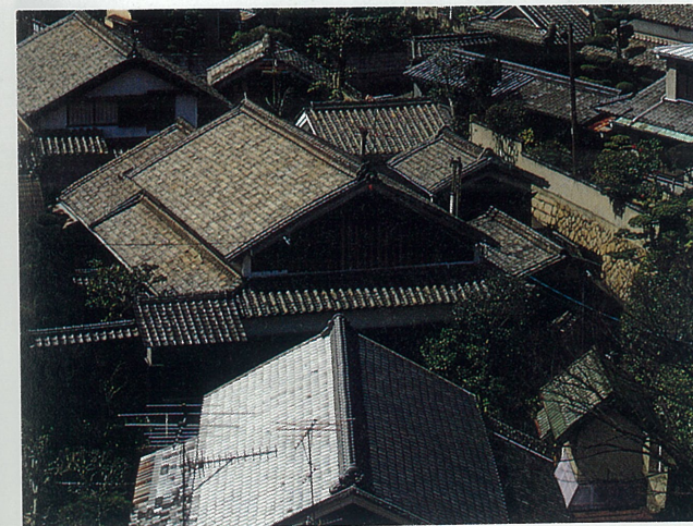
旧三条村の街並み 旧三条村は、17世紀以来、尼崎藩に属し、小村ながら農業や水車産業で栄え、近代に至るまで高い自治性と伝統を維持してきた。