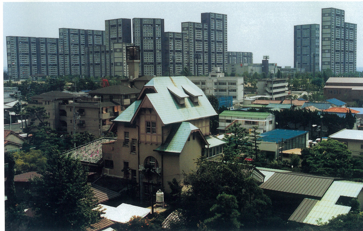
今も残るスケッチブックに描かれた洋館とシーサイドタウンの高層住宅群