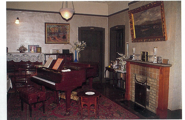
アメリカ生まれの洋館(山手町) この地の洋館としては最も初期の大正11年に建てられた。原設計はアメリカで行われたが、あまりにも壮大であったため縮小して建てたという。