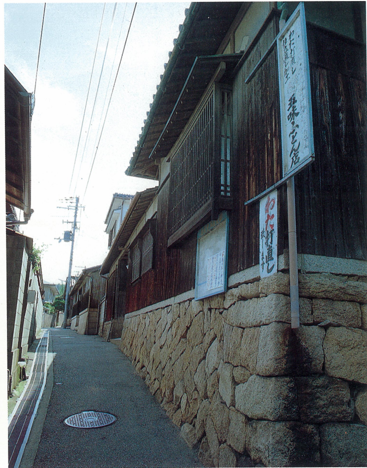
旧三条村のメインストリート(三条町)

現代の都市空間にはない、懐かしさと安らぎを持った風景は、貴重な歴史的遺産であり、時として未来への示唆も与えてくれるでしょう。