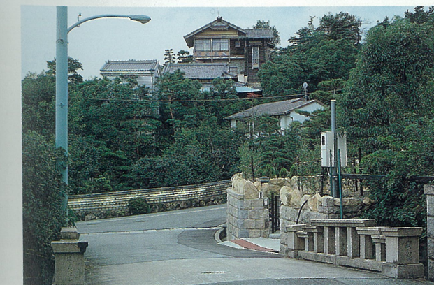
塔のある洋館(六麓荘町) 昭和11年に建てられた塔(展望室)をもつ洋館。