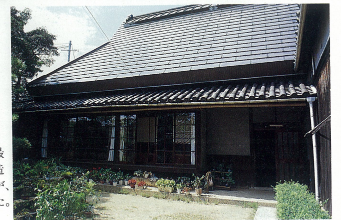
江戸時代の建築様式を残す民家(三条町) 元禄3年の三条村絵図にも見られる芦屋で最も古い民家。当時の庄屋の住宅で、入母屋造りの大屋根はいまはトタンで覆われているが、かつてはよし葺きの堂々たる姿を見せていた。