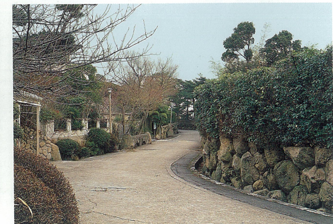
六麓荘町の街並み