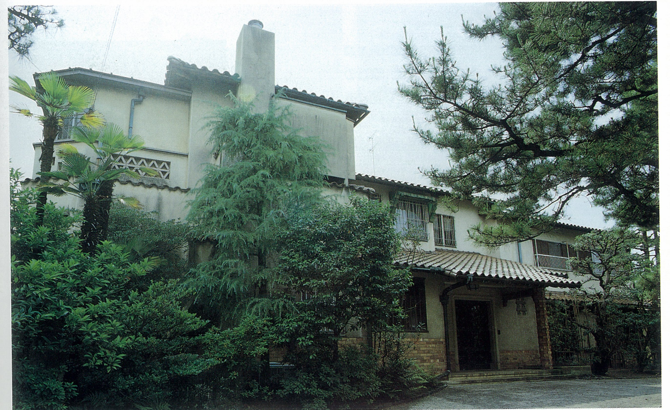
スパニッシュ・スタイルの邸宅