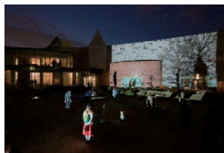
The scene at "rooms" in 2016 ふうけい ねん おもてのぶただ rooms 風景 2016年