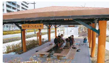
潮芦屋げんき足湯