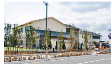
潮芦屋交流センター