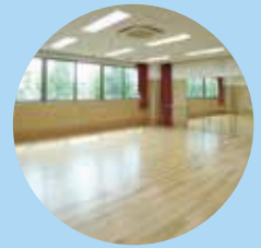
潮芦屋集会所 Shio-Ashiya Assembly Hall

Ashiya Municipal Shio-Ashiya Exchange Center