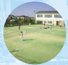
屋外交流広場 Outdoor Exchange Plaza