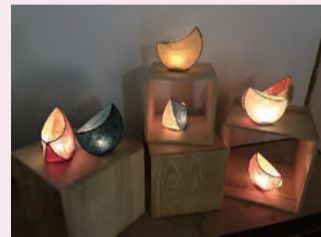
体験講座完成見本「月あかり」

～あかりの庭～美しい庭園を眺めるあかりのある風景。体験講座は、月の形のフレームにお好きな和紙を選んでランプシェードを作ります。キャンドルとLEDライトタイプからお選びいただけます。