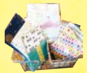
《Space R (リュリュ)》 文房具セット