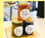
《パヴェアルチザン》 季節のフルーツジャムセット