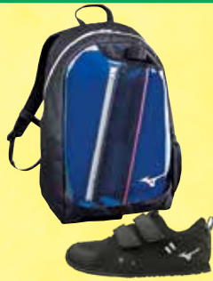
《ミズノスポーツ潮芦屋》 キッズシューズ/ バックパック (ジュニア)