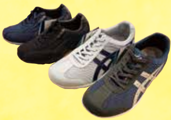
《アシックスウォーキング芦屋》 ウォーキングシューズ