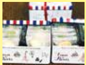
《米粉クッキー店J・プリエ》 米粉クッキー缶

その他、アロマデザイン芦屋、ペットグラン芦屋、アトリエ三体夢、田中金盛堂より記念品のご協力をいただいています。