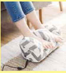
《ヤマダ電機テックランド芦屋》 フットマッサージャー