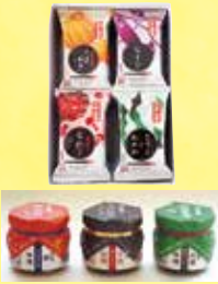
《六甲味噌製造所》 おかず味噌・ フリーズドライ 味噌汁セット