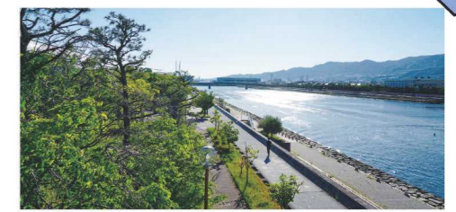
チャンネルパーク 芦屋浜と南芦屋浜の間の海域水路と両側の緑地や親水性護岸はチャンネルパークと呼ばれています。水路ではヨットやカヌーなどのマリンスポーツを楽しんでいる姿を、親水性護岸では散策を楽しめます。