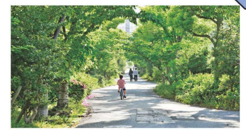
中央緑道(シーサイドプロムナード) 中央緑道は、緑が多い歩行者専用道です。途中には、日本庭園風の西浜公園があります。西浜公園は、小さな池や滝、植物などがあり、風情を醸し出しています。