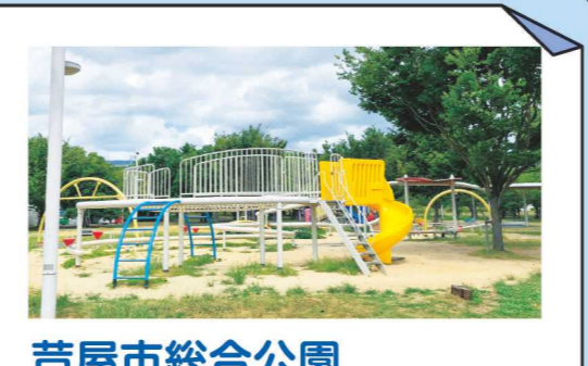
芦屋市総合公園 芦屋市総合公園には、子ども向け遊具、芝生広場、ピオトープ、バーベキューコーナーなど様々な施設があります。