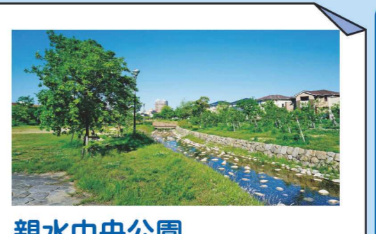
親水中央公園 親水中央公園は、せせらぎがあり、夏には子どもたちの水遊びができます。また広い多目的広場があります。