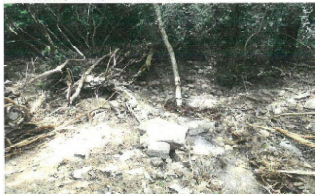
新たな水路設置場所