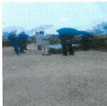
六甲最高峰(931m)にて、銘板を確認する。(一等三角点)

次に、六甲最高峰で神戸市と三条津知財産区の共有山であるプレートを見て頂く(雨天のため、現地へは委員長他5名、事務局1名参加)