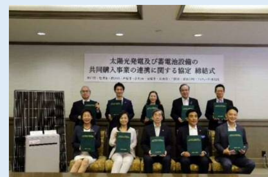
共同購入の調定式

さらに、令和4年4月より阪神間の9自治体と連携し、太陽光発電システム及び蓄電池システムの共同購入を開始しています。この取組により、市民・事業者が再エネ設備を導入する新たな選択肢を提供し再エネ設備の導入を推進しています。