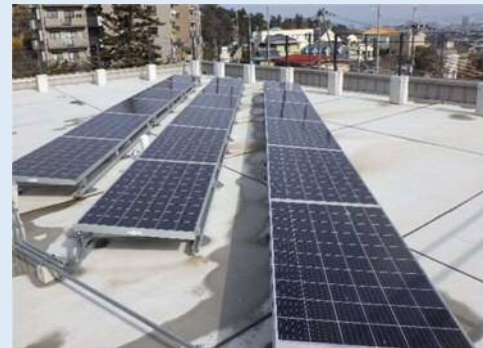
芦屋市霊園事務所に設置した太陽光発電システム

令和4年度からは市内の公共施設10施設と本庁舎・小中学校等の教育施設に再エネ100の電力の導入を開始しており、年間約2500tの温室効果ガスを削減することとなり、これは芦屋市の公共施設から排出される温室効果ガスの約19%に相当します。