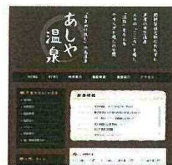
あしや温泉ホームページトップ画面

まず、その立地条件、湧出し温度の高い天然源泉、源泉スタンドの利用方法と注意事項、そして阪神淡路大震災と関係深い沿革。ホームページで初めて知った方が、足を運んでみたいと感じて頂けるよう、工夫しています。