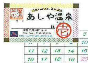
あしや温泉スタンプカード

スタンプカードを作成しました。スタンプカードを貯めると「あしや温泉オリジナルロゴ入り景品（タオル）」がもらえる等、リピーターにとって魅力的な景品を用意しました。また、スタンプカード自身が1枚ずつの使い捨てではなく、スタンプカードにカードを集められた枚数番号を捺印。スタンプを貯める魅力を付加しています。（吉番～九番）