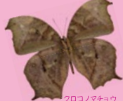
クロコノマチョウ