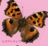
ヒオドリクチョウ