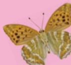
ミドリヒョウモン