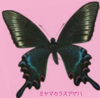
ミヤマカラスアゲハ