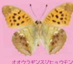
オオウラギンシホウモン