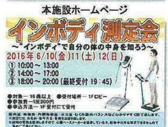
健康づくりイベントを開催