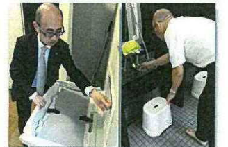
本施設清掃インスペクションの様子