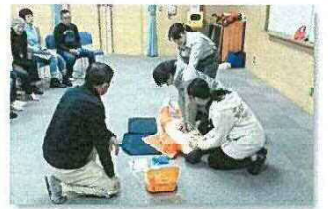
本施設救命法講習の様子