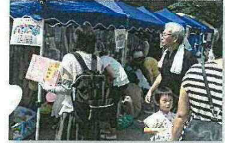
あしや保健福祉フェアの様子