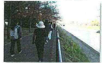
ウォーキング教室の様子 (本施設実例)