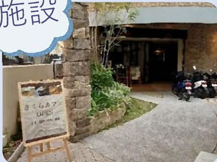
『カフェのお手伝い』