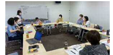
図3: 主任ケアマネジャーの会

コロナ禍により研修開催を中止していたが、令和3年度は開催回数を減らして事例検討会を開催。【図2】並行して主任ケアマネジャーや研修修了者を対象とした講師養成講座を開催(ケアマネ友の会主催)。主任ケアマネジャーの会で研修シラバスを作成。【図3】令和4年10月からは主任ケアマネジャー講師による基礎講座開催