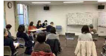
図2: ケアマネジメント事例検討会

平成26年に基礎講座をスタートし、年度によっては複数コースを開催。多い時は、様々な分野から70人を超える専門職が参加者。平成30年から、より実践的な学習機会として事例検討会を創設。外部講師を招くことなく、研修修了者や市内の主任ケアマネジャーが検討会のファシリテーターを担うシステムで運用を開始。