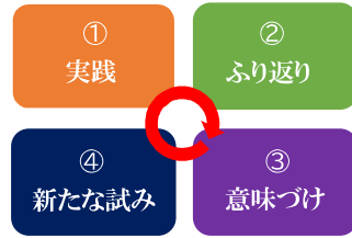
図1: 経験的学習サイクル

この応用的実践力の習得に最も有効とされる学習法が、実践を繰り返し、実践を評価・意味づけ・概念化し、新たな試みを明確化する「経験的学習サイクル」と言われるもの【図1】。しかし、多くの相談援助職は、コロナ禍により「利用者との面接」や「ケア・カンファレンス」など対面の業務を省略することを余儀なくされ、さらには対面の会議や研修会、自主的な学習会の機会を奪われ、自身の実践を丁寧に繰り返す機会を失っているが、“仕事”として成立しているように見受けられ、省察的実践家として存在することの意義を見失いかけている。