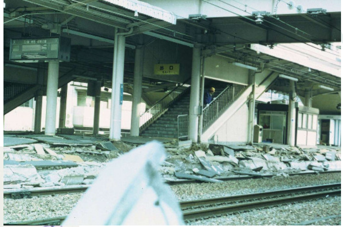
JR 芦屋駅プラットフォーム