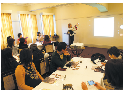
写真家でRecon PHOTO SCHOOL 主宰の田川梨絵先生による写真撮影の授業風景