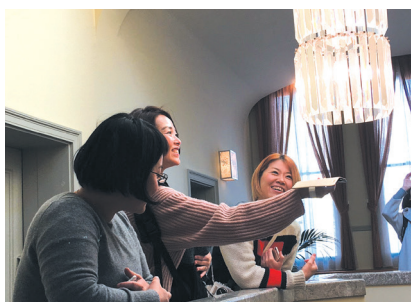
授業後のモノリス内外での実践撮影の様子