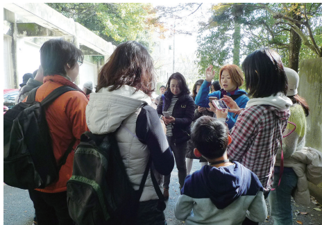
写真家の田川梨絵さんによるSNS映えする写真の撮り方レクチャーを熱心に聞く参加者の皆さん。