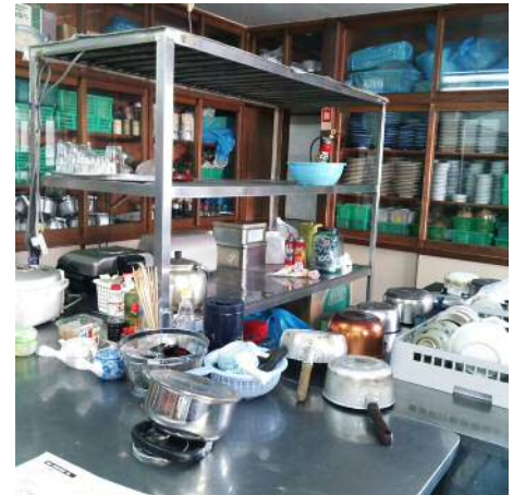
↑リノベーション前のキッチン