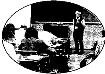
【見学日】平成23年8月23日(火)午前 【所在地】京都府長岡京市開田