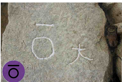
防長萩(長州)藩毛利秀就の刻印です。奥山刻印群を中心に分布しています。