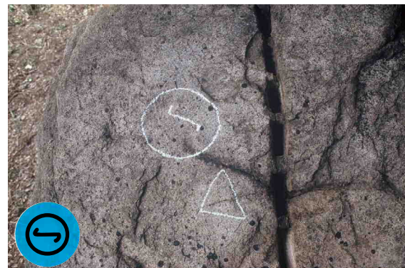
鳥取藩池田光政の刻印です。右の刻印は「伊木三十郎ニシノミヤ内し者」と書かれています。伊木三十郎は、池田家の筆頭家老です。