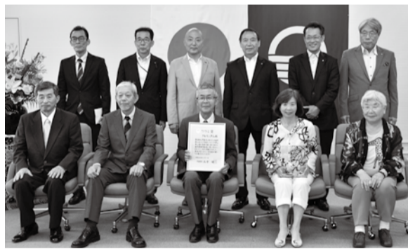
6月1日(金)贈呈式の様子

「アルペン芦山」は、芦屋ロックガーデンの地元登山会として、六甲山を登山しながら清掃を行う活動を、昭和42年より50年もの長きにわたり定期的実施されています。昭和53年からは、加盟する兵庫県勤労者山岳連盟の「兵庫の山からゴミを一掃する運動」に取り組み、近年では2カ月に1回芦屋地獄谷の清掃活動をされています。この取り組みで、登山道のゴミは著しく少なくなりました。この長年の活動は、自然環境保護を通じて美しく住みよいまちづくりに大きく貢献されています。