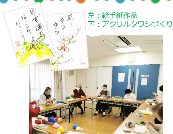
左：絵手紙作品 下：アクリルタワシづくり