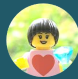
I love Ashiya