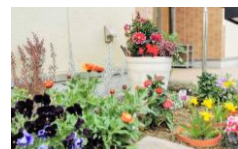
竹園集会所の花壇

浜芦屋町自治会の美化活動 (清掃と花壇整備) 毎月第2水曜日 午前9時～ 浜芦屋児童遊園集合