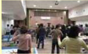
講話の後のリフレッシュ ラジオ体操