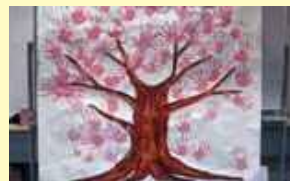
桜が完成しました