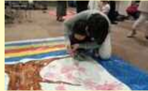
みんなで桜の花を咲かせよう!! みなさんの手をお借りしました!