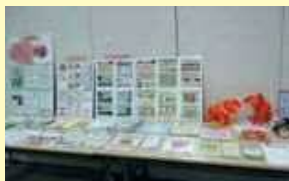
認知症に関する情報コーナー