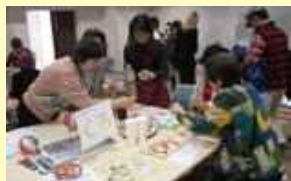
認知症に効果のある脳トレ