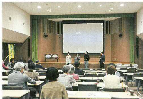
山手中学校の生徒さん

山手中学校の生徒さんと協働で作成した地域福祉計画【中学生向け概要版】の紹介、発表「芦屋の地域福祉」をすすめるための取組として、ボランティアグループ芦屋山手超丸会の生徒さんと、打合せを重ね完成した地域福祉計画【中学生向け概要版】の紹介を行いました。最後には、実際に作成に携わった生徒さん本人が登場するというサプライズもあり盛り上がりしました。