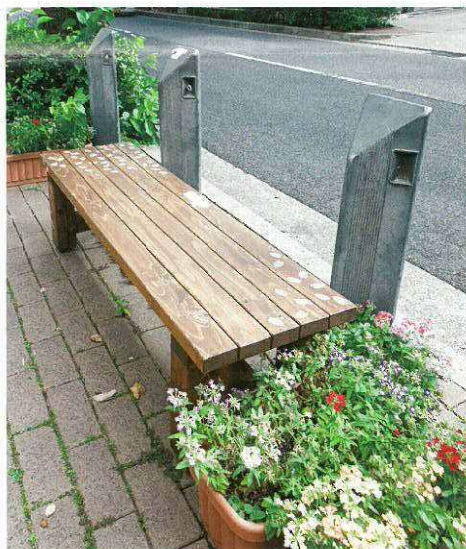
茶屋之町に設置したベンチ