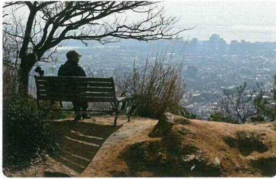
フォトコンテストin Ashiya 最優秀作品「城山のベンチ」

2012年、ベンチデザインコンテストでベンチデザインを募集し、最優秀賞作品となった市内の小学生デザインの「なかよしベンチ」は、現在市内5カ所に置かれています