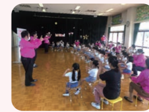
西山幼稚園 (すみれ・いちご組)