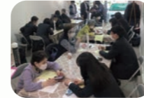
フラスワン打出浜ブーケ