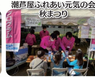
潮芦屋ふれあい元気の会 秋まつり