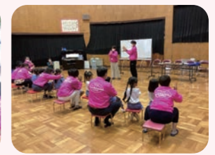
潮見幼稚園 (なでしこ組)