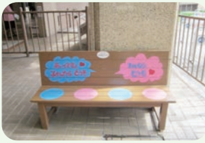
JR芦屋駅 憩いの広場

このプロジェクトを始めて少しずつベンチが増え、ベンチに座って楽しくおしゃべりされている姿を見ると嬉しいです。これからもこのプロジェクトを広げていきたいと思ひます。