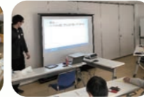
呉川町(自主防災・防犯会 情報班)