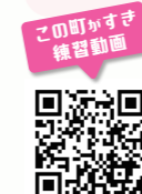
この町がすき 練習動画