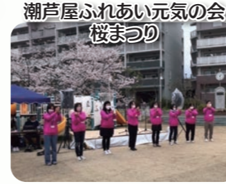
潮芦屋ふれあい元気の会 桜まつり

アクションのロゴが入った ピンクのジャンパーを着ています。 見かけたら声をかけて下さいね★