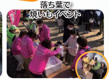
落ち葉で 焼きいもイベント