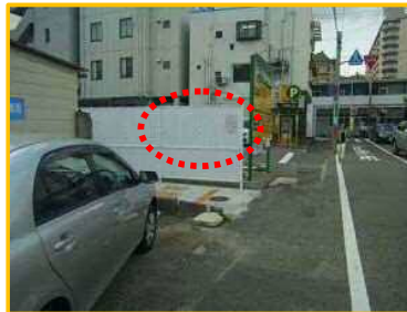
飛び出し注意看板を設置いたします