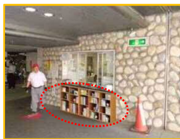
本棚設置イメージ