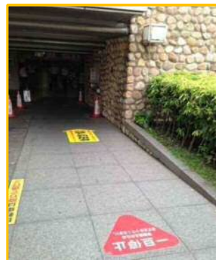
床面シートの貼り付け実例（阪神芦屋駅南自転車駐車場）