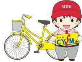
チャーリー 「当社駐車場グループ イメージキャラクター」

巡回時以外にも、放置自転車が「通路を塞いでいる」「重なり倒れている」「点字ブロックを隠している」等々のケースには、自ら率先して自転車を整頓し、市民を危険な状態から守ります。