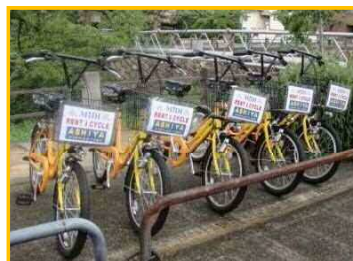
現在、阪急芦屋川駅北自転車駐車場にて実施中

さらに、子供向け自転車もご用意し自転車が初めてのお子様の練習用としてや、親子でのサイクリング等の機会をサポートいたします。(利用料金は1回100円をご提案いたします。)