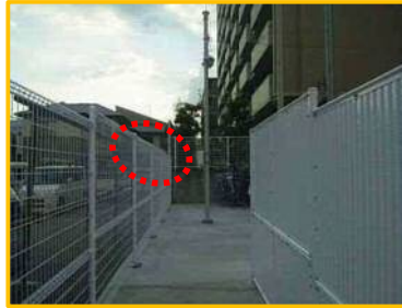
通路から場内が見えるようにカーブミラーを設置いたします

JR芦屋駅南自転車駐車場5は出入口が狭い通路になっており、通路側からは自転車駐車が内が見えない構造です。接触事故防止のためにフェンスにカーブミラーを設置いたします。また、出入口が歩道に面しており、場内から出る際に左側がフェンスで死角になっております。フェンスに飛び出し注意喚起看板を設置し、事故防止に努めてまいります。