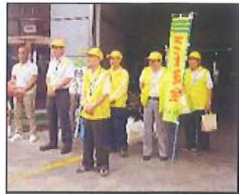
独自キャンペーン活動写真