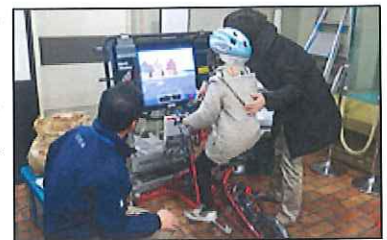
自転車シミュレーターの運用風景

バーチャルな街を走行し、街中での 自転車の運転を模擬的に体験 します。インストラクターによる解説を聞きながら、事故が起こりうる危険な場面を安全に体験して、ルールに沿った自転車の乗り方を学ぶことができます。