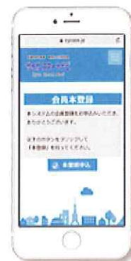
サイカスマートナビ画面

「サイカスマートナビ」とは駐輪場（駐車場も可）の 定期管理業務をシステム化 したものです。利用者は Web により、ご自身で定期利用の「登録・更新・支払い」ができるようになります。また当システムは前述の「 定期更新機 」と 連携 でき、さらに利用促進の向上に繋がると考えます。