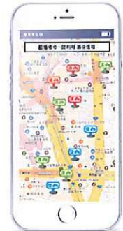
駐輪場検索のイメージ図