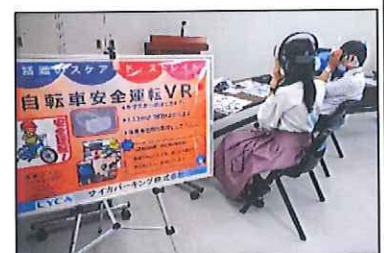
VRゴーグル運用風景

今春からCSR活動に新しく導入しました。VRゴーグルを通して 自転車に関する事故の追体験 ができます。映像は大阪府警に監修いただき、プロのスタントマンを起用しました。体験者からは「本当に怖かった。自転車の運転時には十分に気を付けます」などの感想をいただきました。