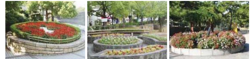
阪急芦屋川駅前広場

芦屋には花壇のある公園がたくさんあります。その多くは地域の方々がお花を育てているんですよ。