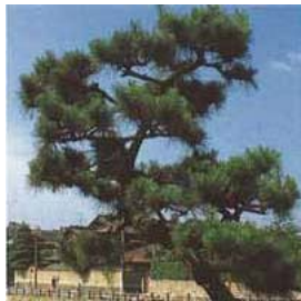
芦屋市の木「クロマツ」