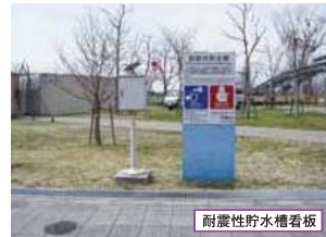
耐震性貯水槽看板