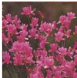
芦屋市の花「コバノミツバツツジ」