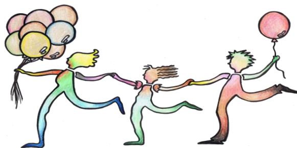
ウィザスあしやフェスタイメージマーク